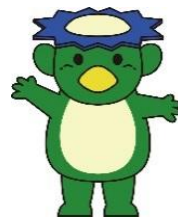
昭島市公式 キャラクター ちかっばー