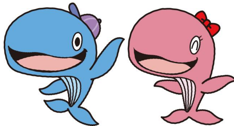
昭島市公式キャラクター アッキー&アイラン